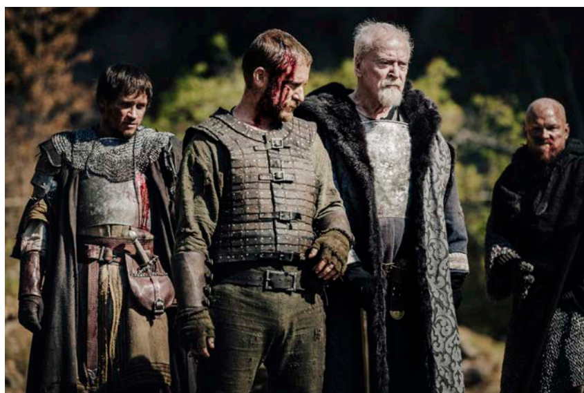
Středověk byl krutý... Druhý zleva Ben Foster v titulní roli Jan Žižky, vpravo od něj Michael Caine v roli lorda Boreše

zachraňuje život a k tomu jej ideologicky vzdělává. Jediná totiž registruje jakéhosi Jana Husa a sociální citění ji vede k obraně životů ubohých obětí násilných vpádů té i oné protivné strany. Na Kateřiny odkazy k Husovým myšlenkám odpovídá Žižka: Ale tohle je válka! Tím ospravedlňuje nejen bezcitnou, takřka nekřesťanskou surovost své družiny, ale zároveň i scenáristické postupy; snímek není o moc víc než sledem drsných bojových scén poslepovaných plytkou historkou v rádobě středověkých kulisách. Vzorem mu prý byl trhák Stateček srdce, ale možná by tuto funkci splnila i dostatečně temná a krvavá počítačová hra. Přes na závěr přišpendlené, všeobecně použitelné heslo o boji za svobodu a přes hekto-